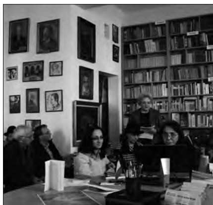
Asociația „Lyceum Profesor Vasile Țugulea”. Organizatorii manifestării au