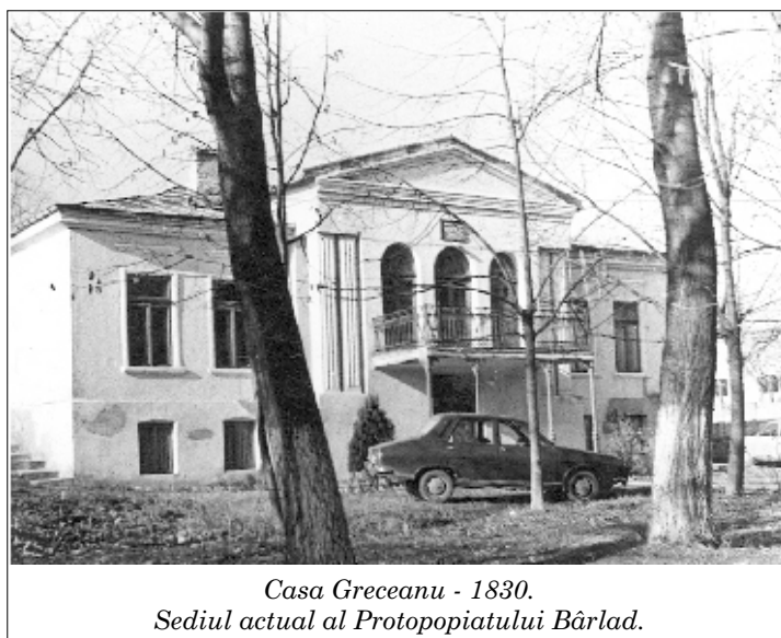
Casa Greceanu - 1830. Sediul actual al Protopopiatului Bârlad.