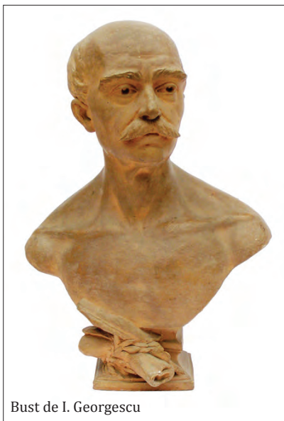
Bust de I. Georgescu

Învingător al morții! – Căci chipul tău trăiește, Poete fără de seamă, slăvit de mic și mare. Tu ce-ai iubit poporul, poporul te iubește Și-n inima lui caldă, păstrează a ta cântare.