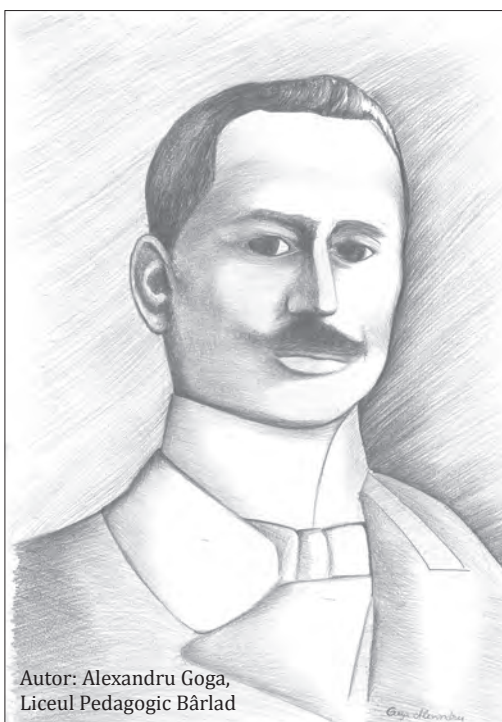
Autor: Alexandru Goga, Liceul Pedagogic Bârlad

Oboseala extrem de accentuată după susținerea