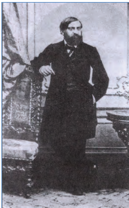
Manolache Kostaki Epureanu (1820-1880)